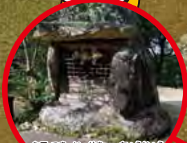
楯築遺跡の頂上 旋帯文石が 収められていた祠