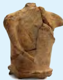
ひとがたとせいひん 人形土製品