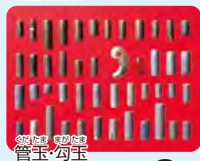
くわたま まがたま 管玉・勾玉

1976年~1989年に岡山大学の考古学研究室が発掘調査をしたよ。これらはその時に出土した遺物の写真だよ。